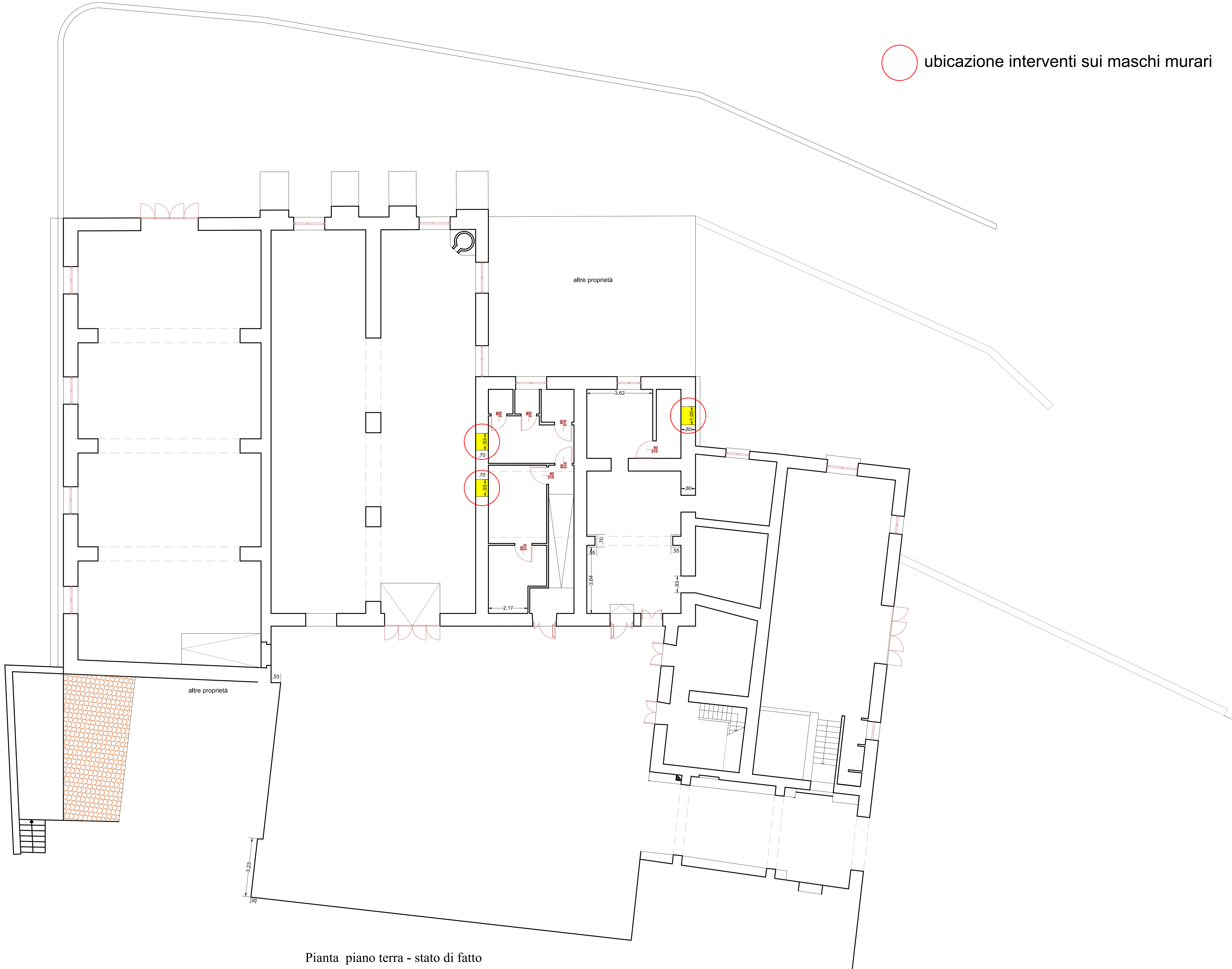
Pianta piano terra - stato di fatto