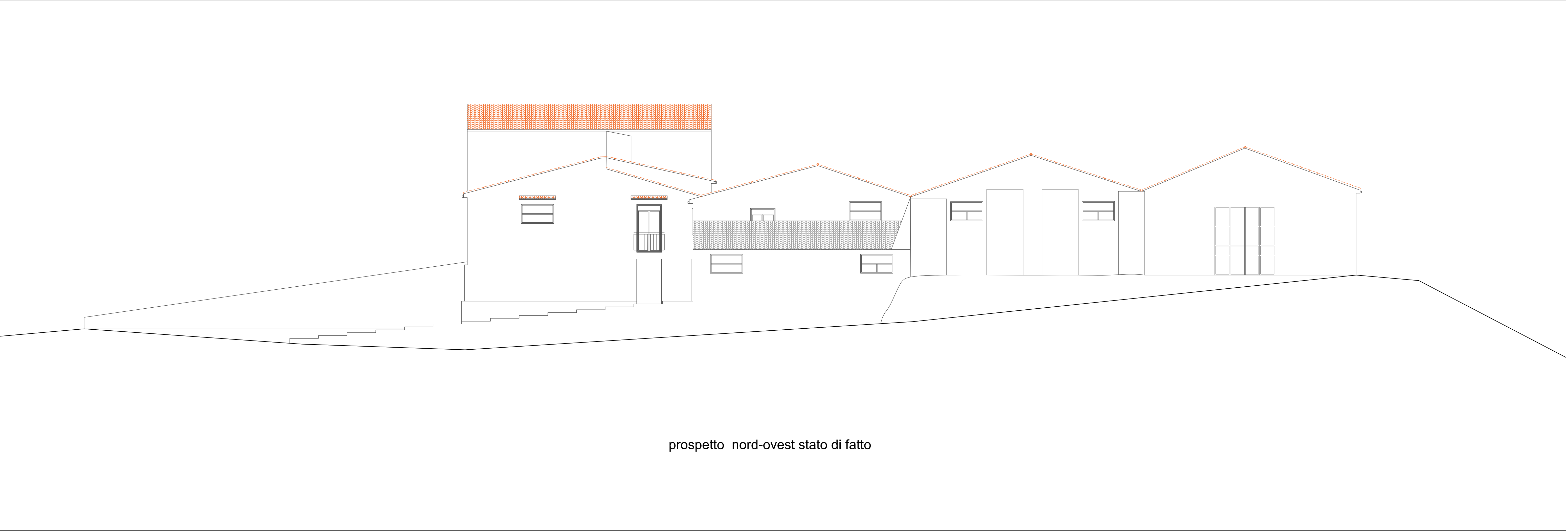
prospetto nord-ovest stato di fatto