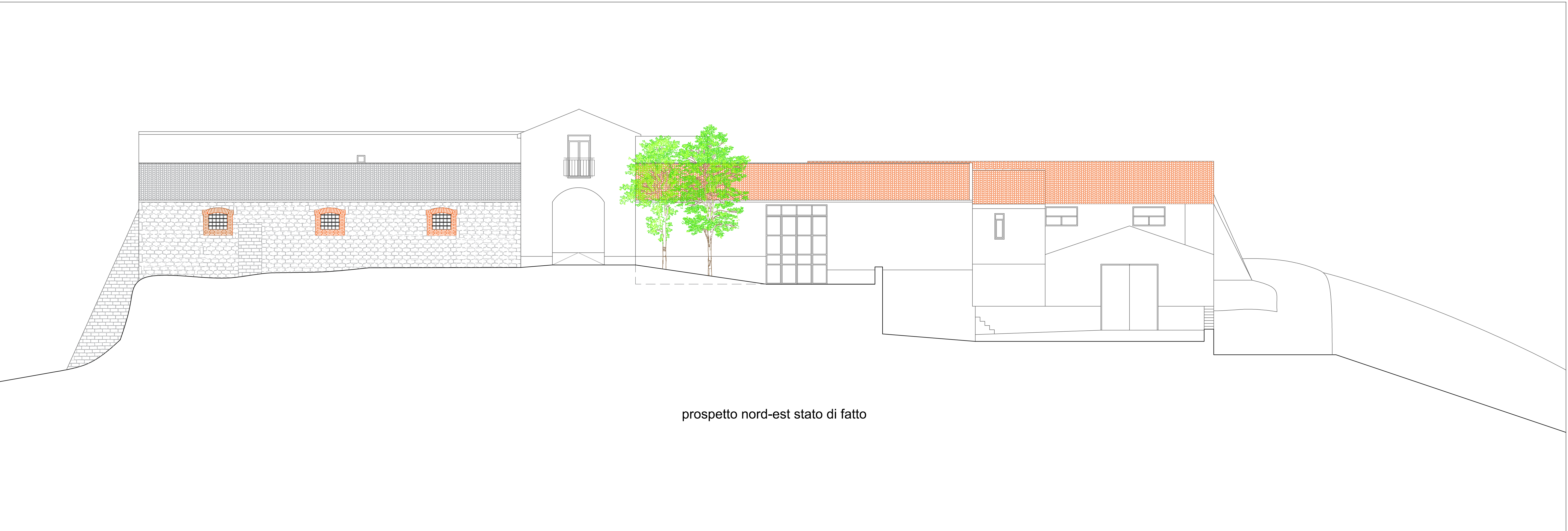
prospetto nord-est stato di fatto