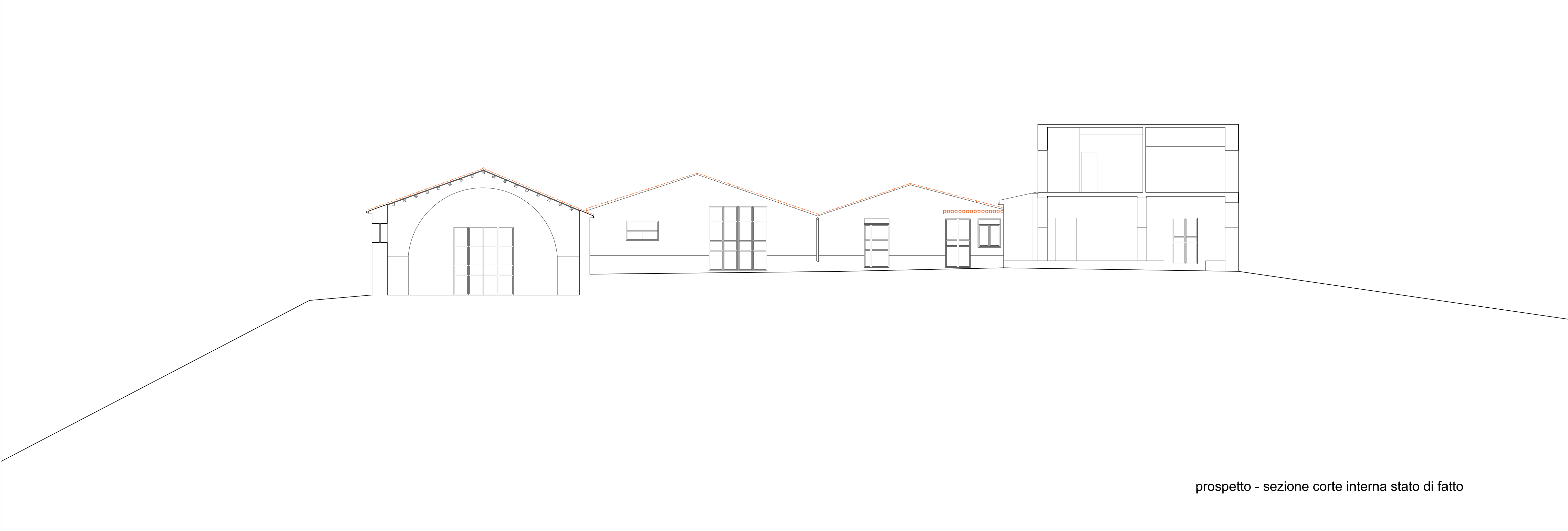
prospetto - sezione corte interna stato di fatto