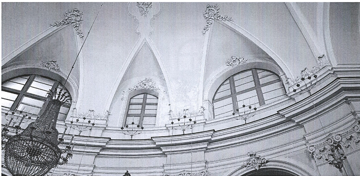
FOTO 2 – Intradosso della volta – manifestazioni d’infiltrazione d’umidità dalla copertura