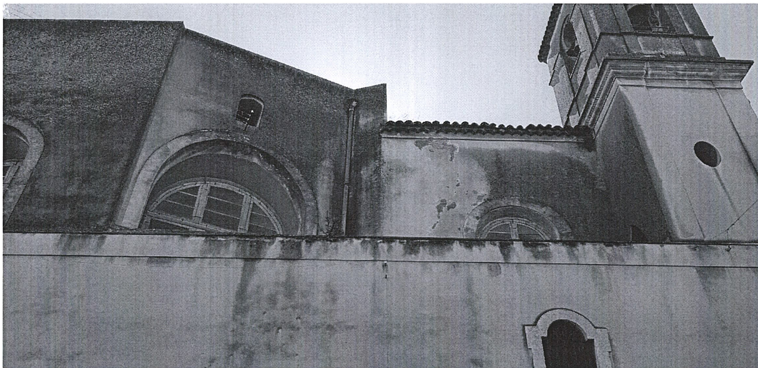
FOTO 9 – Prospetto nord - distacco generalizzato dell'intonaco esterno di facciata, sul secondo ordine di facciata.