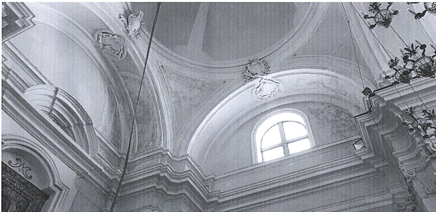
FOTO 1 – Zona Presbiteriale – manifestazioni d’infiltrazione d’umidità dalla copertura