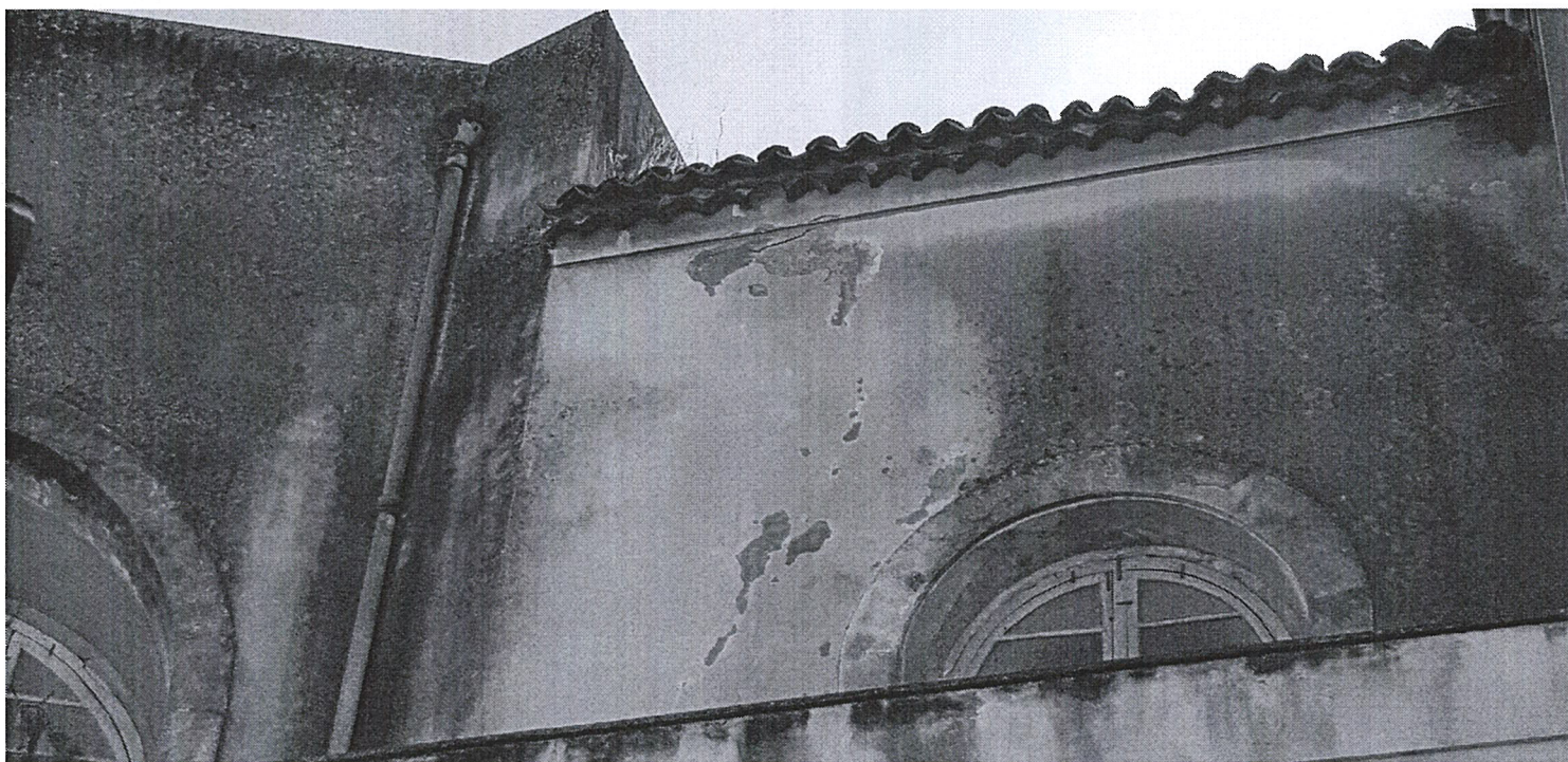
FOTO 10 – Prospetto nord - distacco generalizzato dell'intonaco esterno di facciata, sul secondo ordine di facciata.