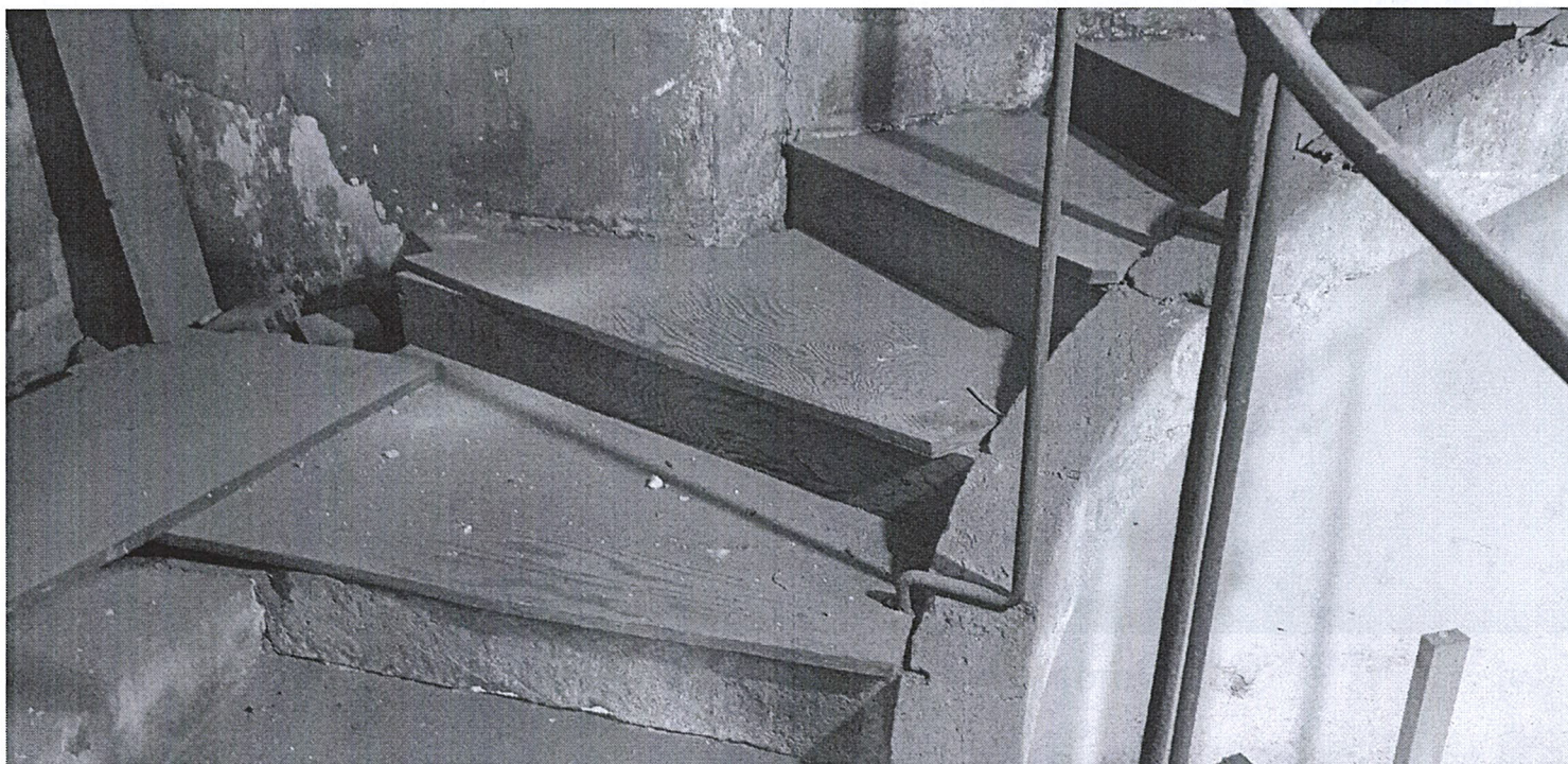
FOTO 6 – scala a chiocciola lapidea – pedate dei gradini gravemente danneggiate ricoperte da tavole in legno