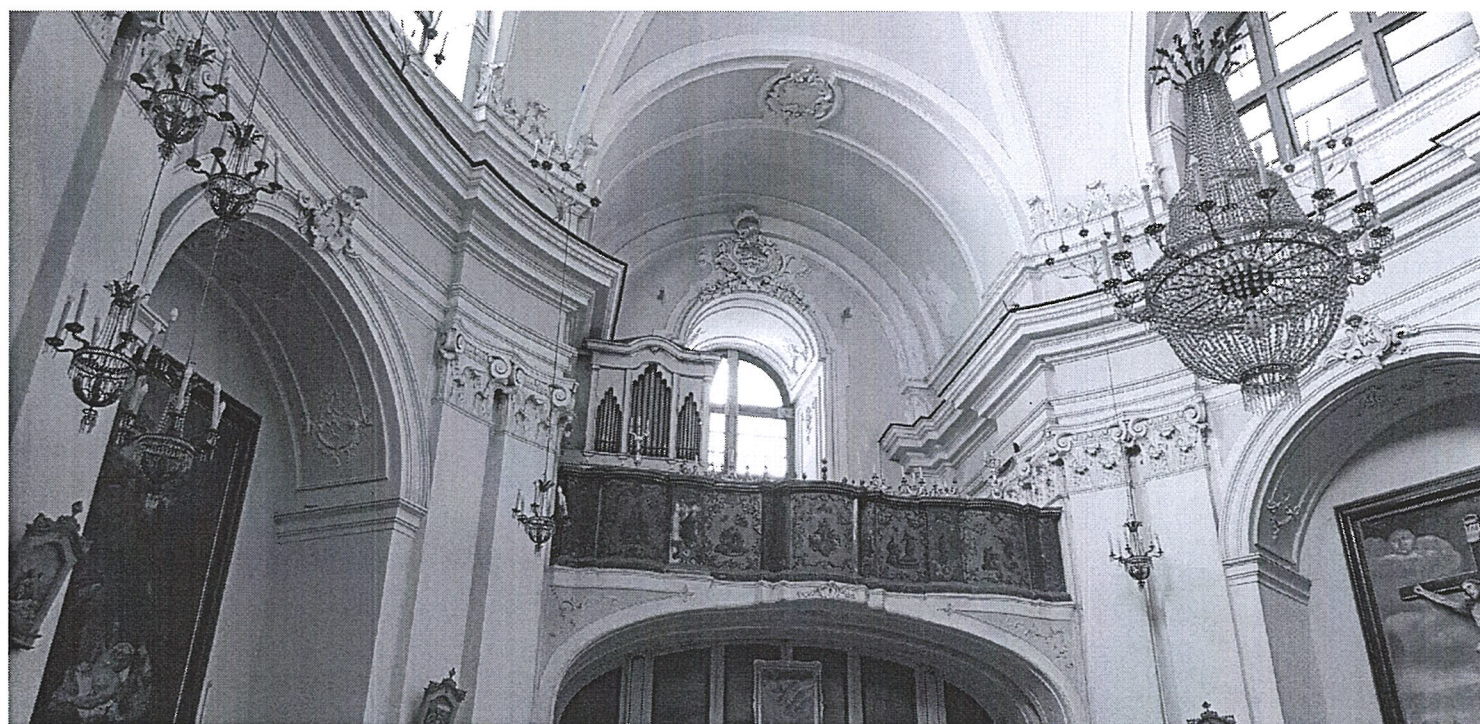
FOTO 4 – zona cantoria con manifestazioni d'infiltrazione d'umidità dalla copertura